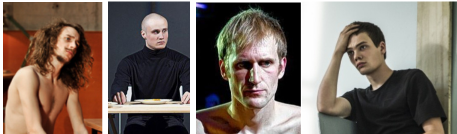
2012 (Berlin) 2014 (Moskau) 2015 (Würzburg) 2016 ... der Film